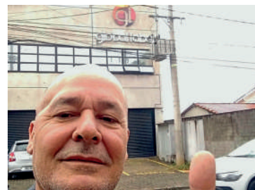
Escritório contábil descumpria a data definida pela CCT. Sindicato agiu e empresa garantiu o direito dos gráficos

a CCT obriga toda gráfica a distribuir uma cesta básica mensal a seus trabalhadores. Define até a quantidade e a qualidade dos produtos. E a data limite para a empresa fornecer. É todo dia 10 do mês. Tal regra também se aplica quando a cesta for entregue através do vale-alimentação. Logo, a recarga do cartão deve ser feita até dia 10. Gráficos: sejam fortes, sejam sócios. Sindicalizem-se!