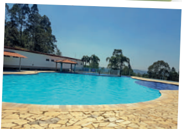
CLUBE CAMPO Associados e dependentes