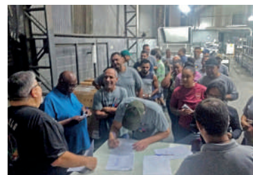
Sindigráficos conquista acordo na Bercrom pondo fim da escala 6x1, redução de jornada e outros benefícios

Bercrom (Valinhos) discorda disso. Inclusive, foram favoráveis ao acordo do Sindigráficos com a empresa para reduzir a jornada semanal para 41h - três horas a menos definida pela atual CLT, o que tem oportunizado a flexibilização da escala 6x1. O acordo ainda garante o feriado do Dia dos Gráficos (07/02), vale-alimentação mensal de R$ 310 e o vale-combustível de R$ 380.