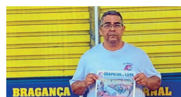
Sob investigação as férias coletivas, possíveis problemas na jornada de trabalho e suspeita da falta de registro de trabalho na carteira

nos dias de semana em que o sábado é feriado - direito garantido pela CCT. A fim de prestar informações, a Gráfica Bragança se colocou à disposição para tratar do caso.