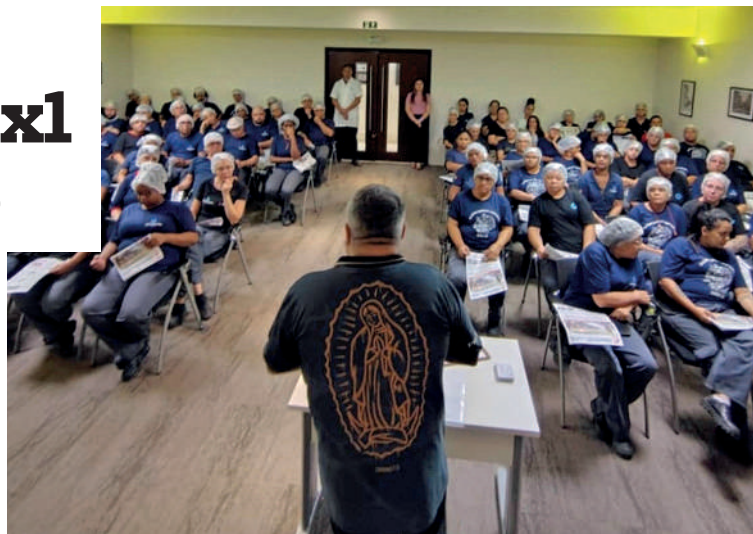
Sindigráficos garante acordo com a Gonçalves pelo fim do 6x1. E continua na luta por mais melhorias na jornada

acordo do Sindicato com a gráfica para evitar o trabalho semanal de segunda a sábado. Contudo, apesar de poucos, ainda teve votos contrários e nulos, demonstrando que ainda há insatisfação dos trabalhadores em terem que compensar horas adicionais ao do expediente para conseguirem a redução de dias de trabalho. Portanto, é preciso reduzir a jornada para 40 horas semanais.