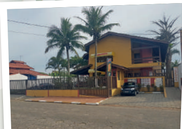
RECANTO DOS GRÁFICOS Associados e dependentes

Para garantir sua vaga, ligue: 11 97199.2087