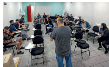
Bônus financeiro extra foi negociado na empresa pelo sindicato para os gráficos que folgam 15 dias por mês na escala 2x2

Uma delas é um bônus financeiro no valor do piso normativo da categoria, além da PLR, que funcionará como um tipo de 14º salário. Outro benefício conquistado pelo sindicato foi a garantia do pagamento de 100% de hora-extra mesmo trabalhando na escala. Pagará quando cair em um dia de feriado.